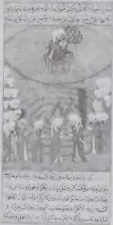
'ಜವಾಹಿರ್ ಅಲ್-ಮುಸಿಕಲ್' ಮಹಮ್ಮದಿ' ಕೃತಿಯ ಒಂದು ಪುಟ